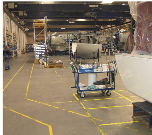
Flere 5S Workshops er gennemført, så fabrikken bliver mere og mere overskuelig og strømlinet.

Opgaverne gennemgås og evalueres undervejs med en "sponsor", der er en leder fra fabrikken, og opgaverne skal desuden præsenteres og godkendes på uddannelsen. Det sikrer, at ledelsen hele tiden er opdaterede på Lean-tiltagene, og for deltagere sikrer det sparring og hurtige beslutningsgange.