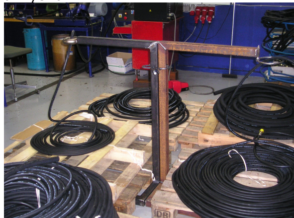
Forbedret system til slangerne gør det lettere og hurtigere at finde og afkorte de rigtige slanger

Derudover blev der sat et mål om, at skabe ensartede montagepladser, så indretning og udseende kunne få et løft. Målet med mere ensartethed var desuden at skabe bedre mulighed for fleksibilitet blandt medarbejderne, og mere effektiv oplæring af nye folk.